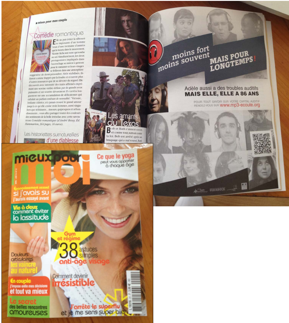
Mieux pour Moi n°21 - avril-juin 2014